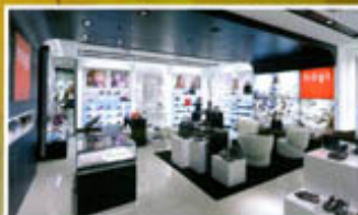
Högl, Sindelfingen Verführen, Verwöhnen, Verweilen Seite 28