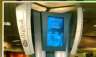
Digital Signage am POS Flachbildschirme mit Inhalt Seite 46