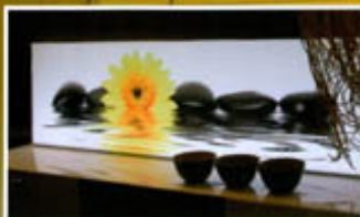
Marktübersicht Dekoration, Bilder und Figuren Seite 22